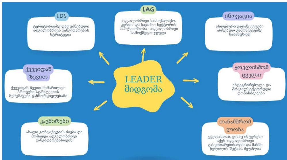
დიაგრამა #1: LEADER მიდგომის 7 ძირითადი მახასიათებელი

LEADER (სოფლის ეკონომიკის განვითარების ღონისძიებებს შორის კავშირი) წარმოადგენს ევროპულ პროგრამას, რომლის მიზანია სოფლის ტიპის დასახლებებში ადგილობრივი აქტორების ჩართვა საკუთარი რეგიონების განვითარებაში. ეს პროგრამა უკვე თითქმის 30 წელია რაც არსებობს და წარმატებით ხორციელდება სხვადასხვა ქვეყანაში. ამ მიდგომის რეალიზაციისთვის იქმნება ადგილობრივი სამოქმედო ჯგუფები (LAG), რომლებიც შეიმუშავებენ და ახორციელებენ ადგილობრივი განვითარების სტრატეგიებს 1 .